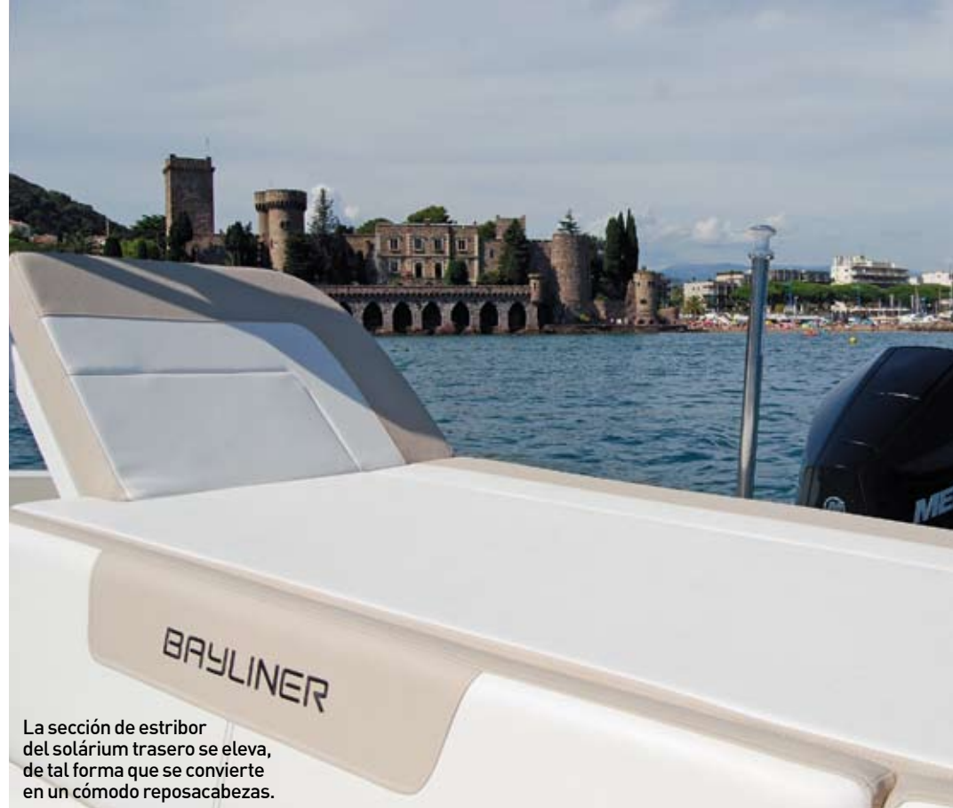
La sección de estribor del solárium trasero se eleva, de tal forma que se convierte en un cómodo reposacabezas.