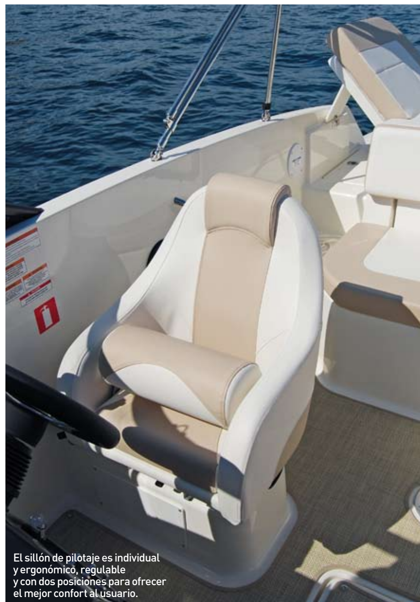
El sillón de pilotaje es individual y ergonómico, regulable y con dos posiciones para ofrecer el mejor confort al usuario.