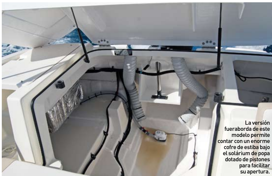
La versión fueraborda de este modelo permite contar con un enorme cofre de estiba bajo el solárium de popa dotado de pistones para facilitar su apertura.