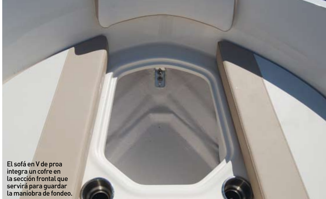
El sofá en V de proa integra un cofre en la sección frontal que servirá para guardar la maniobra de fondeo.

Como en todo buen pilotaje, la elección y la posición de los elementos del puesto de gobierno es clave. En este caso, resulta cómodo y es adaptable. Su sillón individual es regulable y admite dos posiciones de mando. El volante es regulable y presidía, en la unidad probada, un panel de mando que concentraba la relojería en una pantalla Simrad Mercury Vessel View. No falta, tampoco, un reposapiés moldeado, ni un compás, ▶