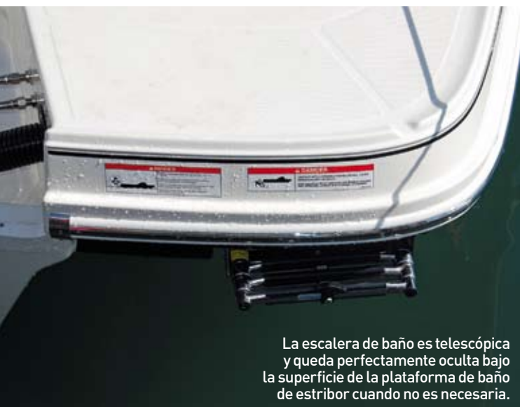
La escalera de baño es telescópica y queda perfectamente oculta bajo la superficie de la plataforma de baño de estribor cuando no es necesaria.