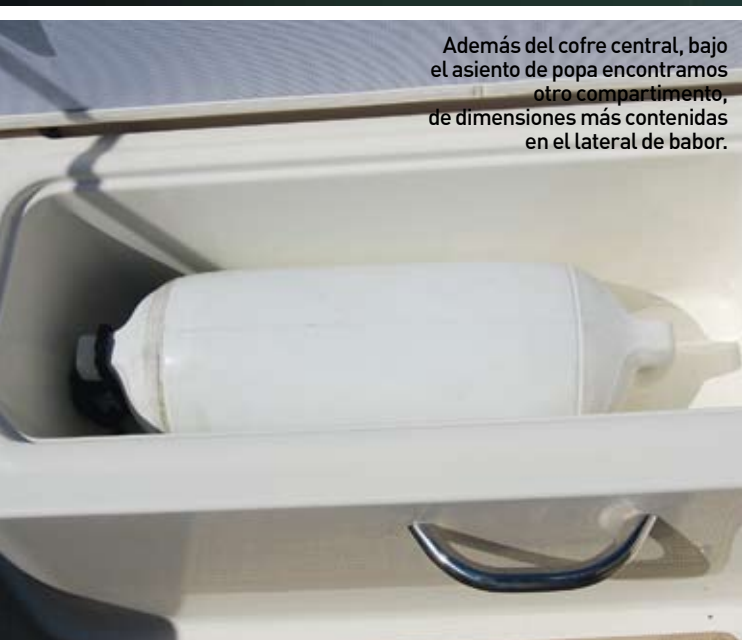
Además del cofre central, bajo el asiento de popa encontramos otro compartimento, de dimensiones más contenidas en el lateral de babor.