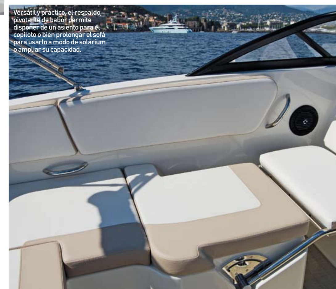
Versátil y práctico, el respaldo pivotante de babor permite disponer de un asiento para el copiloto o bien prolongar el sofá para usarlo a modo de solárium o ampliar su capacidad.

Con 5,60 metros de eslora de casco, la Bayliner VR5 es una propuesta apta para la Licencia de Navegación que destaca por el espacio optimizado que presenta sobre un concepto de bowrider deportivo tradicional. Gana su valiosa superficie extra mediante los diseños BeamForward y AftAdvantage de la firma, que amplían la manga hasta prácticamente el extremo de proa e incrementan el espacio disponible en bañera retrasando la zona de asientos al máximo.