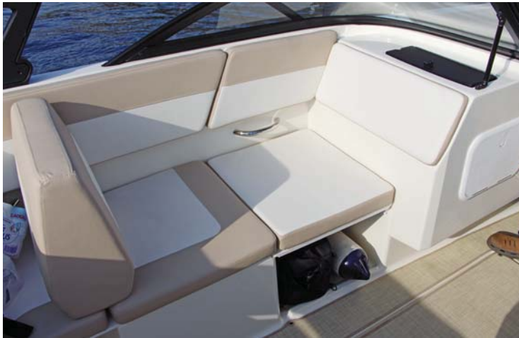
El asiento del copiloto se puede transformar en chaise lounge con un suplemento.