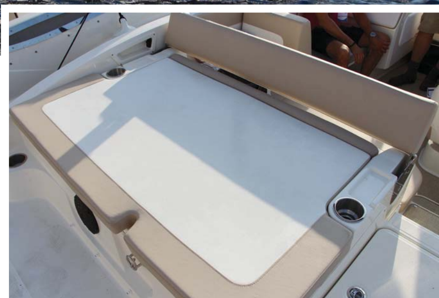
El solárium de popa se amplía mediante el respaldo reversible.