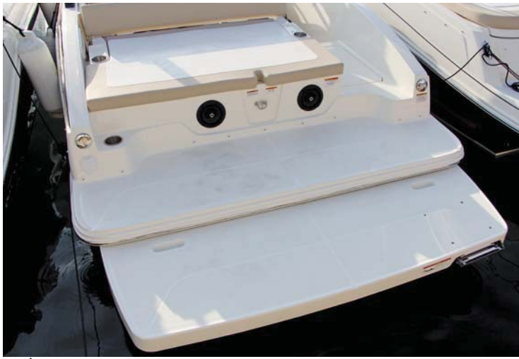
Se adosa una segunda plataforma de baño grande, más baja.