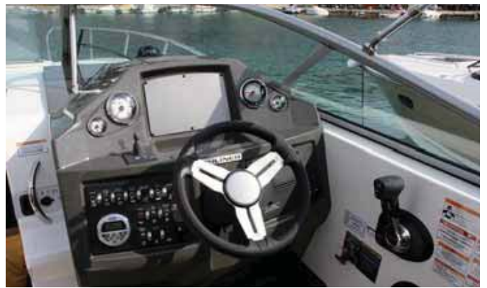
Compacto puesto de gobierno.