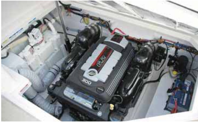
El acceso al motor es bueno por la amplitud del cofre.