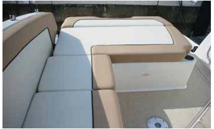
La dinette se abre hacia la plataforma.