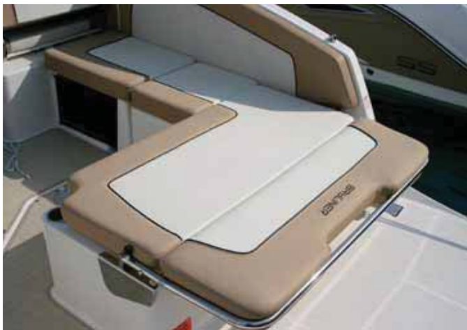
Abatiendo el respaldo se amplía la superficie para tomar el sol.