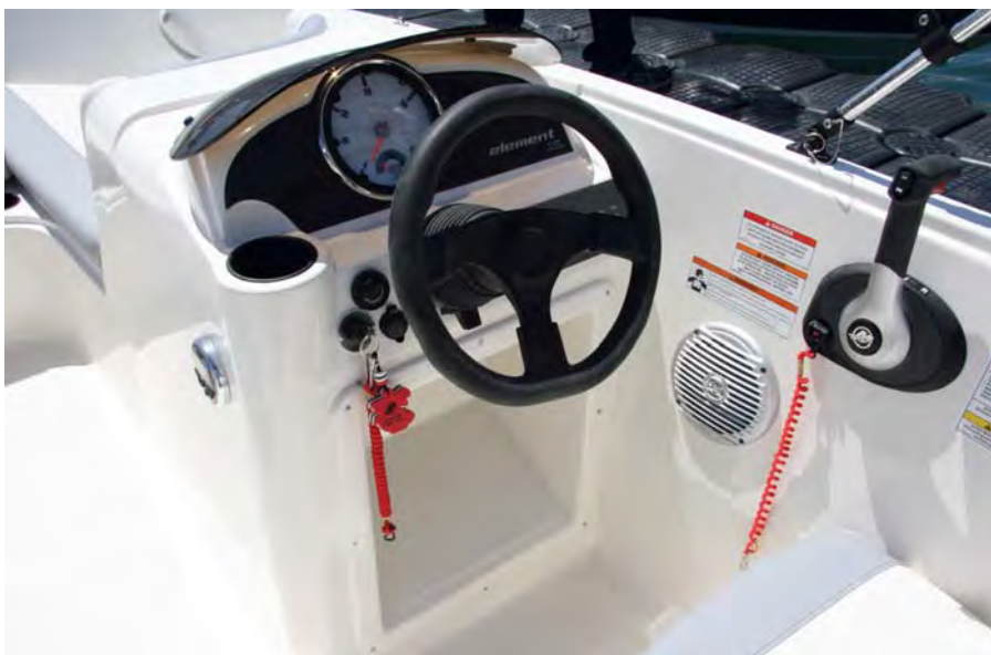
El puesto de gobierno es muy sencillo y con un profundo reposapiés.