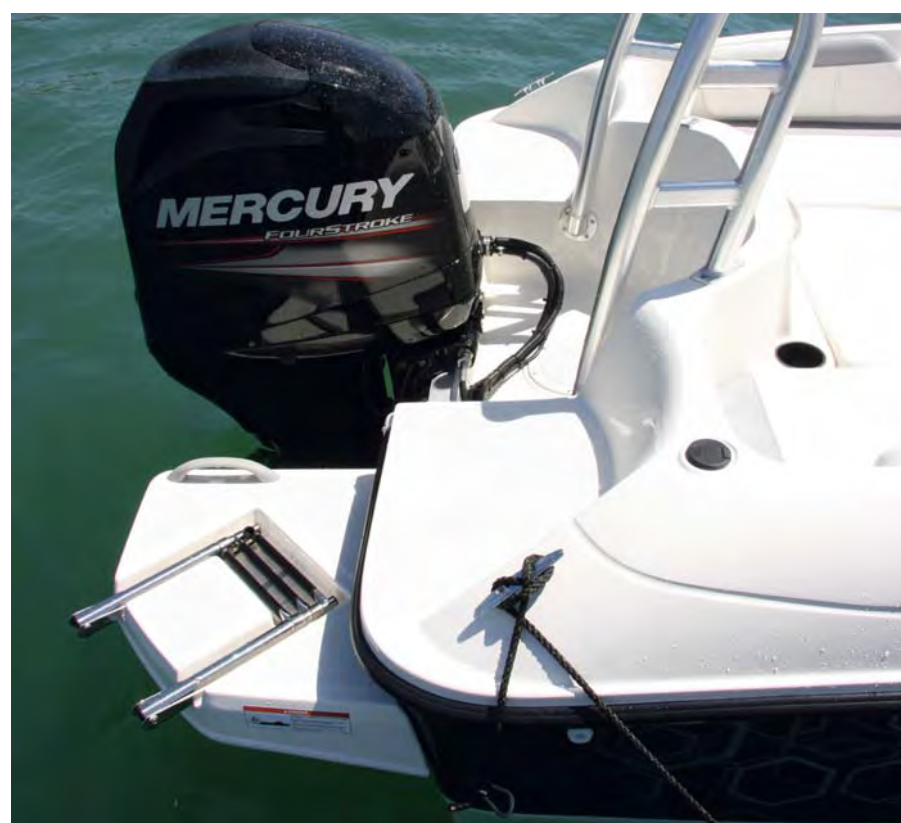
Las plataformas de baño quedan escalonadas en dos niveles.

En popa adopta dos plataformas de baño adosadas, una de ellas con escalera plegable integrada en el molde,