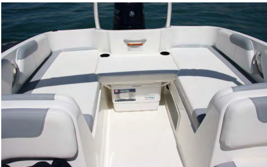
Desmontando el suplemento central se accede a la nevera de arcón transportable.

que rodean el fueraborda, además de la base para un interesante y sólido arco tubular, opcional con el pack Sports, que sirve de soporte para el anclaje elevado de arrastre de wake o para la estiba lateral de dos tablas, además de para una práctica toldilla.