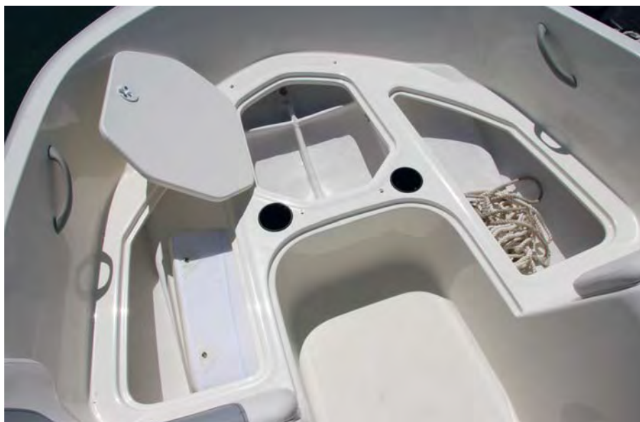
Bajo todos los asientos incluye varios cofres de estiba.