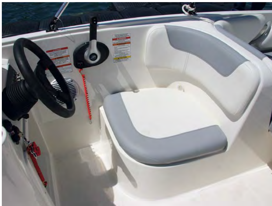
El sencillo asiento del piloto no disfruta de sujeción lateral.