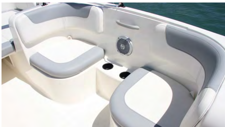
En babor incluye dos sencillos asientos enfrentados con respaldo acolchado.

Ciertamente, el punto en que más debemos fijarnos en este modelo es en el alargamiento de eslora, que amplía significativamente la zona de popa, en donde presenta dos asientos laterales enfrentados, con buena estiba en su interior, y un armario en la parte central de popa flanqueado por un arcón-nevera de hielo transportable. Además, se pueden montar suplementos centrales para formar un recogido solárium acolchado.