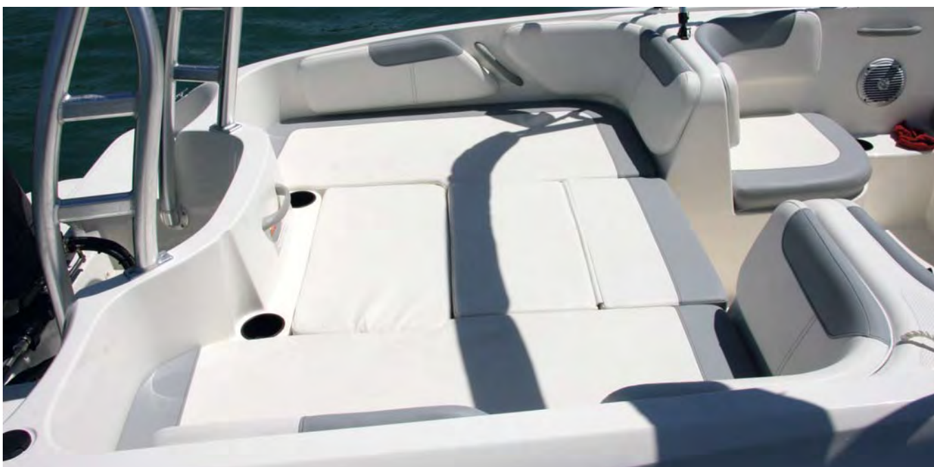
En popa es posible formar un solárium mayor que en el modelo pequeño.