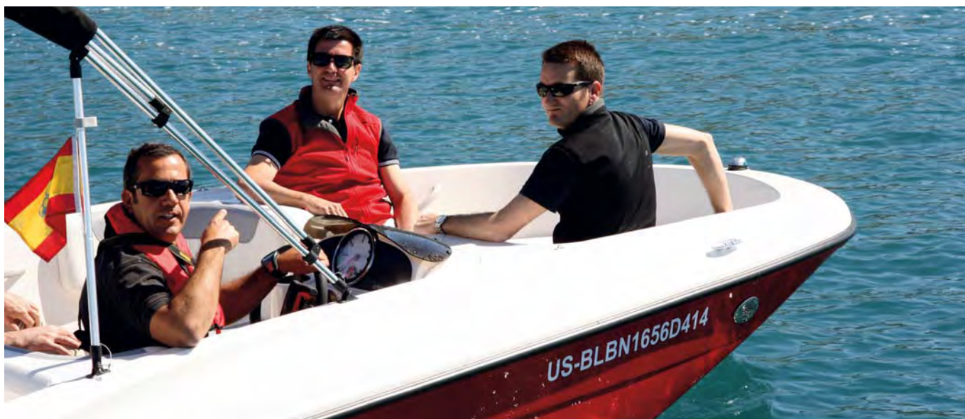
La proa abierta proporciona una gran cantidad de asiento en cubierta.

El astillero Bayliner, perteneciente al grupo norteamericano Brunswick Marine, mostró a la prensa especializada la primera evolución de la nueva línea Element presentada la pasada temporada y marcada por su revolucionaria carena multicasco y su amplitud de cubierta.