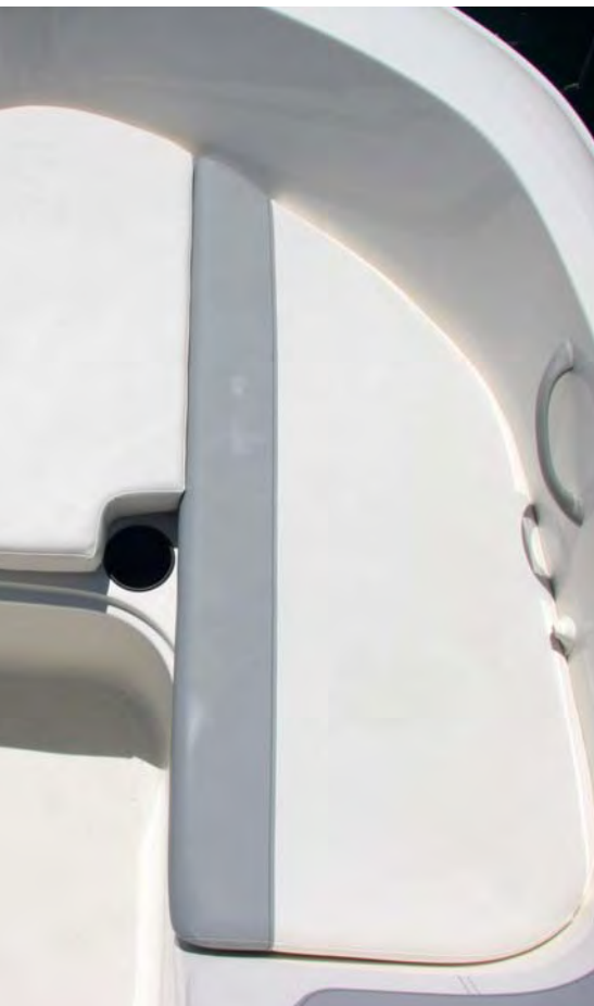
En proa hay una buena superficie de asiento y relax.