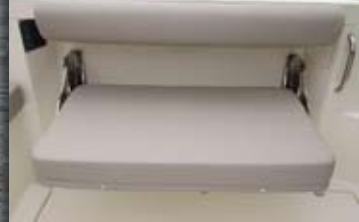
El lateral de la bañera puede dotarse de este robusto banco plegable heredado de Boston Whaler, muestra de la sinergia entre las firmas del grupo Brunswick.