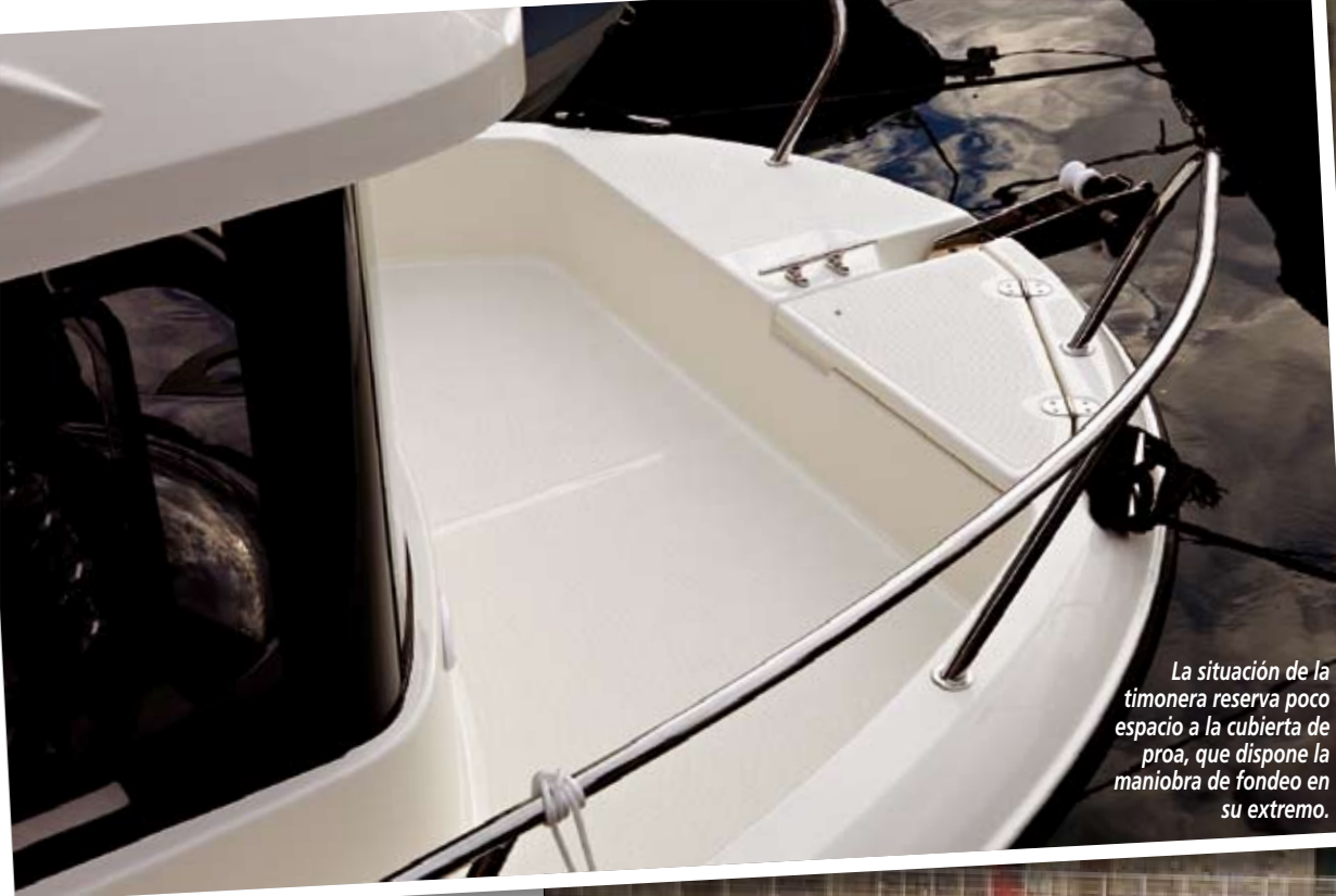
La situación de la timonera reserva poco espacio a la cubierta de proa, que dispone la maniobra de fondeo en su extremo.