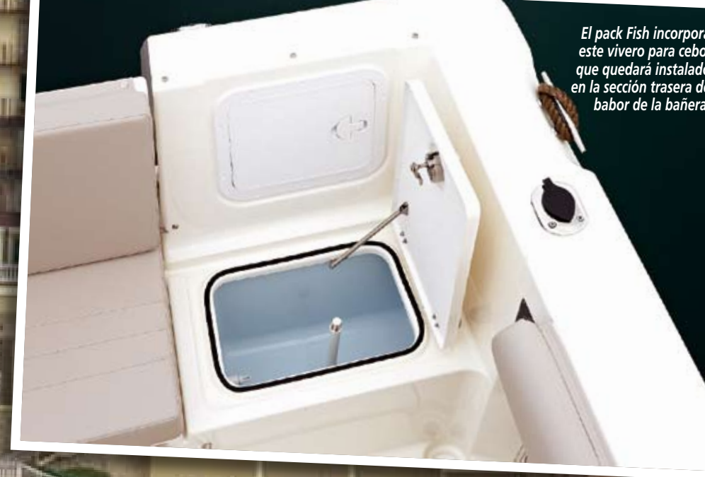
El pack Fish incorpora este vivero para cebo, que quedará instalado en la sección trasera de babor de la bañera.