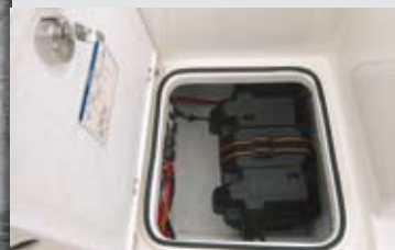
Este cofre, en la sección de estribor de popa de la bañera, sirve para estibar y dar acceso a las baterías.

P or las características del diseño destaca, por supuesto, la bañera, de dimensiones generosas, pero también la oferta de hasta cuatro packs de opcionales encargados de adaptar el barco a las necesidades de cada armador. A través de ellos puede ampliarse la dotación de pesca, de la cabina o de la bañera, mientras que la Edición Smart integra los tres packs anteriores a un precio competitivo y con cortos plazos de entrega.