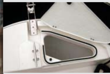
La maniobra de fondeo queda integrada de forma estándar por el cofre de anclas y una roldana de proa.