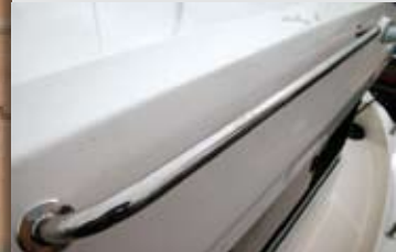
La presencia de un pasamanos como este a cada lado de la timonera aporta seguridad a la circulación.