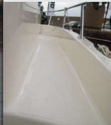
La disposición asimétrica de la timonera reserva un pasillo de ancho seguro y confortable a estribor, protegido por un ligero francobordo y el candelero.