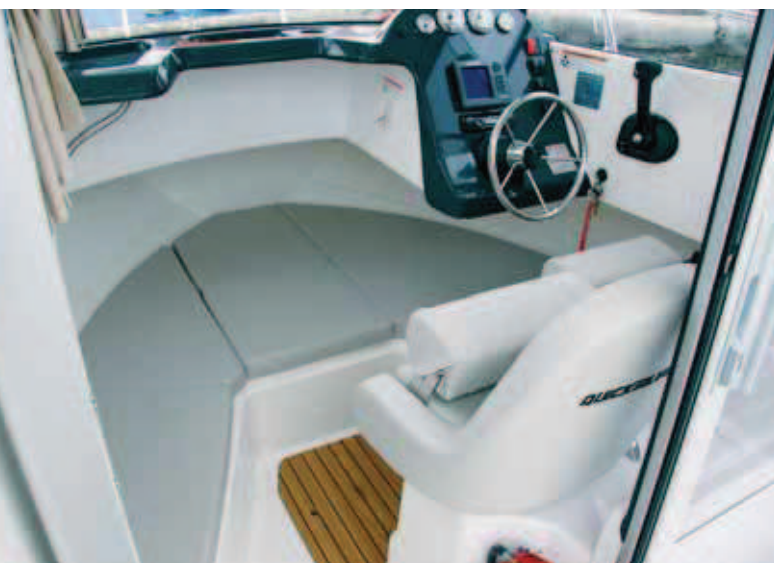
El luminoso interior es sencillo y bien aprovechado.

Por su parte, el resto de la cabina queda ocupado por una cama triangular realizada sobre diversos cofres de estiba que podría contar con suplementos para ampliar su tamaño.