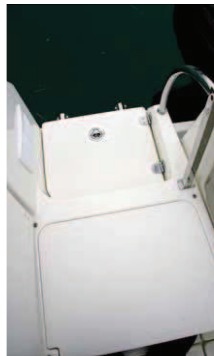
El pasillo se forma sobre la tapa que cubre la escalera de baño.

Dispone de una bañera bastante grande y con buena protección gracias a su francobordo interior, que acoge cañeros y reposacañas, además de cuatro grandes cofres de estiba en el suelo y un largo asiento de banda a banda ocupando la popa, con una sección lateral desmontable para crear el acceso al fueraborda. Opcionalmente, también puede incluir una mesa desmontable y una práctica banqueta lateral de gran robustez, que se puede plegar para ampliar el espacio libre.