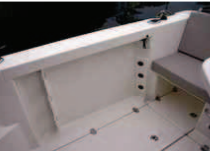
Los reposacañas laterales