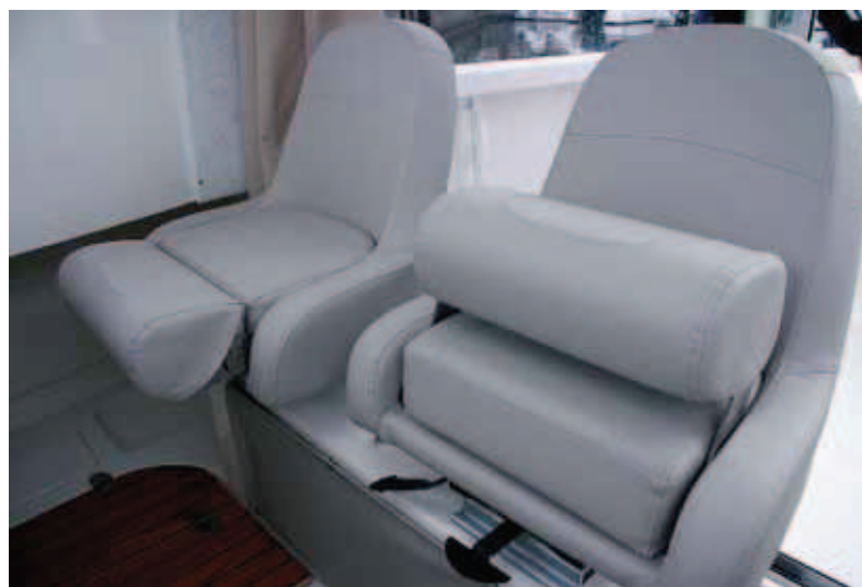
Dos asientos de base practicable se montan sobre una elevada estructura.