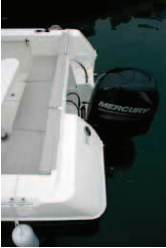
Su respaldo practicable