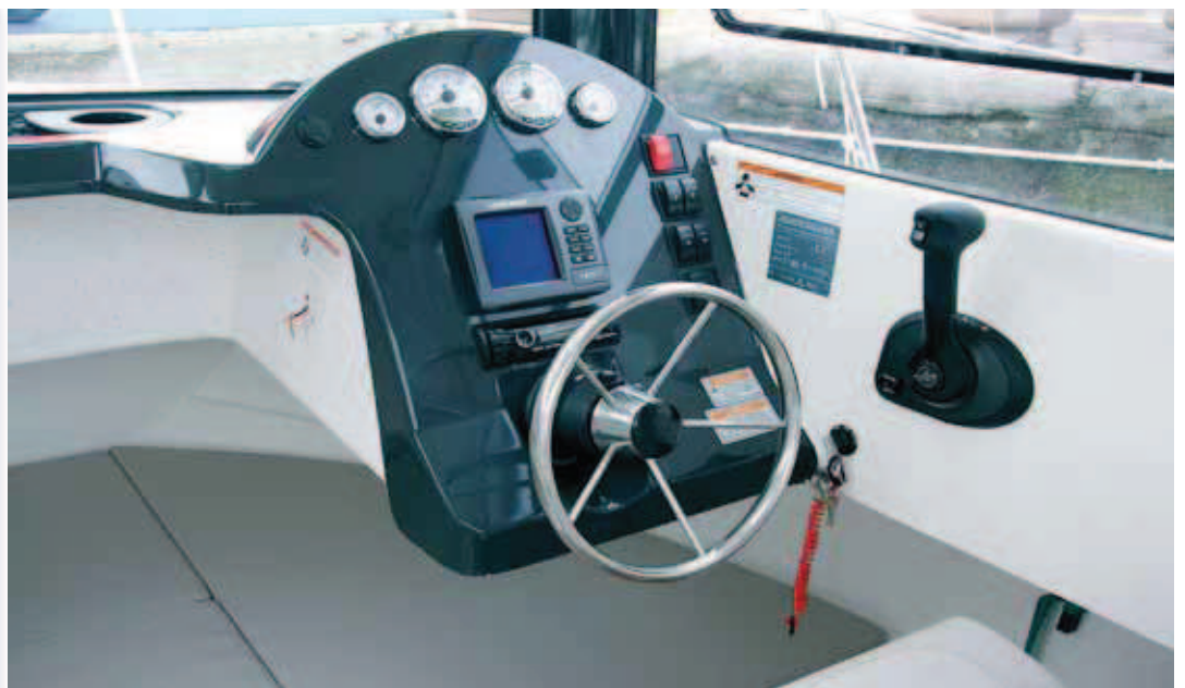
La sencilla consola queda colgada de la base del parabrisas.