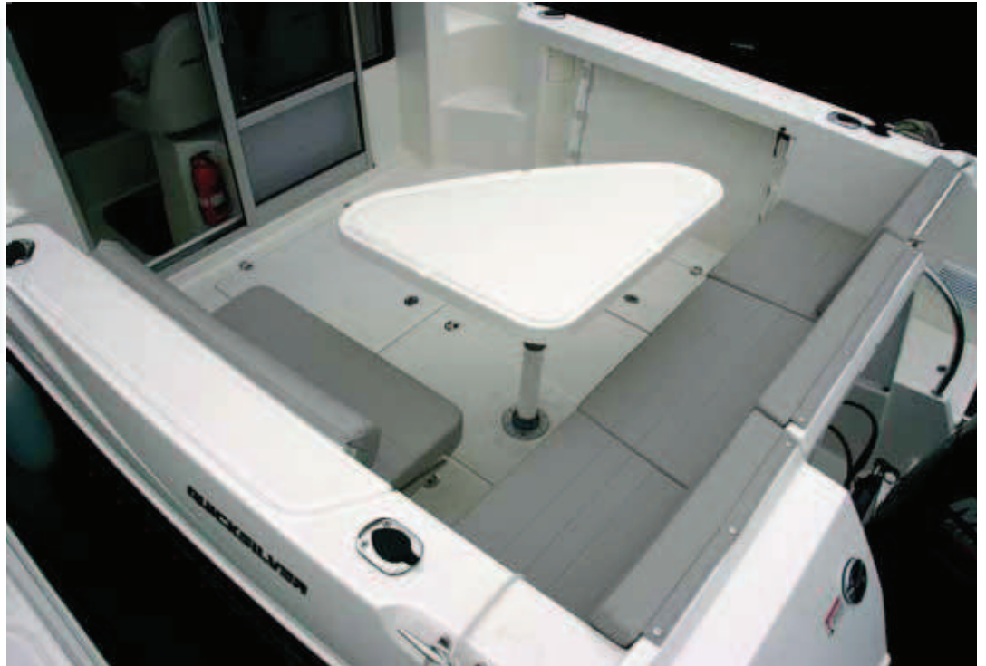
La mesa irregular permite crear una dinette exterior en bañera.

Los pasillos que rodean la cabina, por supuesto asimétricos para ampliar el volumen interior, son de tamaño suficiente para alcanzar con bastante seguridad la cubierta de proa, en donde únicamente ofrece un cofre de fondeo con molinete exterior y balcón abierto.