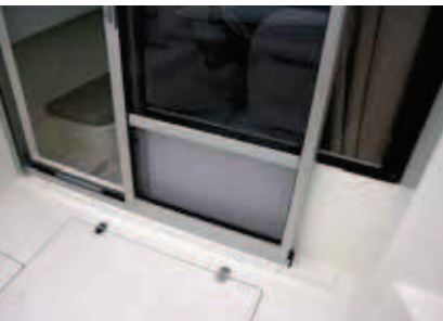
El refuerzo de la puerta