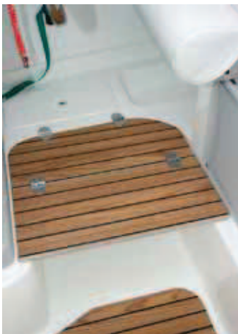
El reposapiés plegable