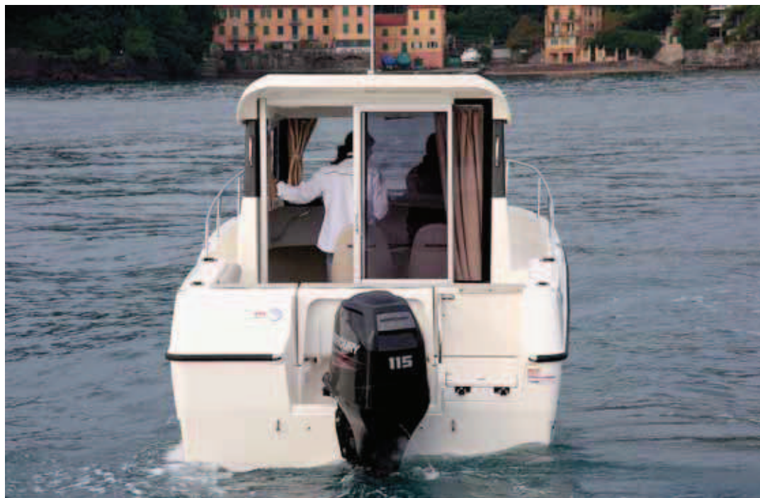
Cuenta con una popa alta que ofrece buena protección posterior.