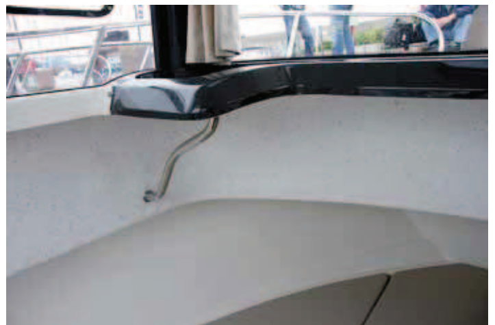
Algunas paredes prescinden del acabado de contramolde.

Es factible pensar que en unas condiciones peores que las que tuvimos durante la prueba –mar plano y dos personas a bordo– la embarca-