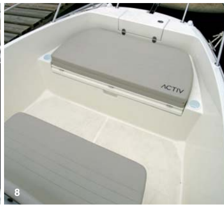
5 y 6. La proa de la Open dispone de un estupendo pozo de anclas además de un cofre de estiba bajo el banco de proa. 7 y 8. La Activ 675 Open permite formar un solárium entre los dos bancos con el añadido de una pieza suplementaria. 9. La Activ 675 Sundeck ocupa toda la proa con un gran solárium que cubre la cabina.