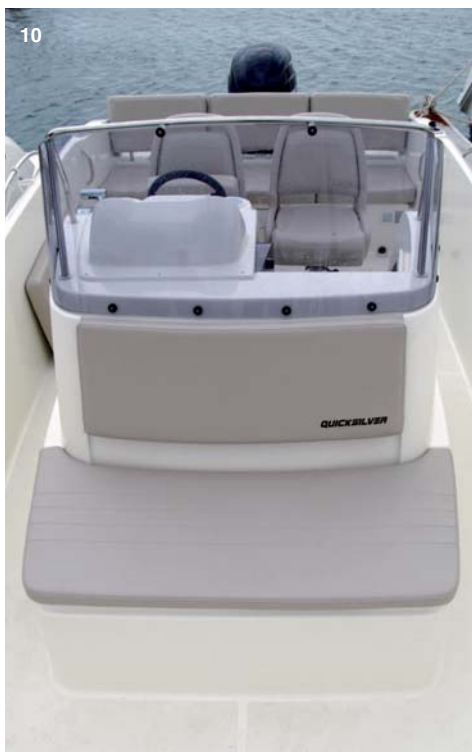
10. La consola de la 675 Open es más estrecha y deja pasos laterales a ambos lados.