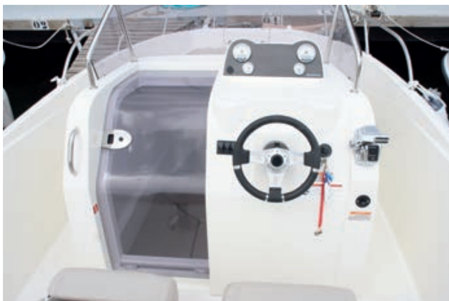
La consola central es ancha, práctica y de aspecto sencillo.