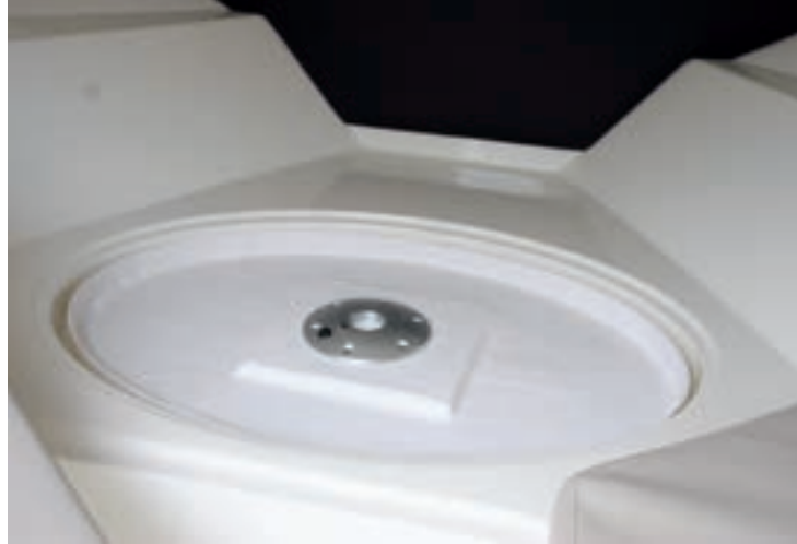
La mesa exterior se estiba bajo la tapa de un cofre de la cabina.