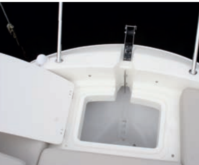
La tapa del cofre de fondeo de la Open acoge parte del perfil estructural.