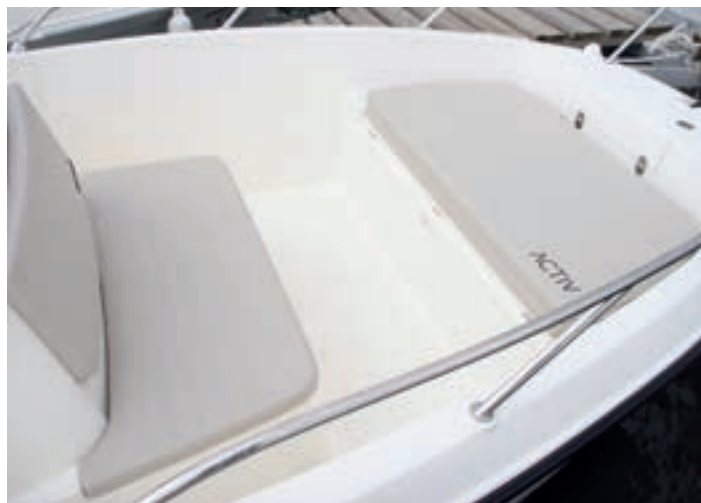
En la popa de la Open se enfrentan dos asientos sobre sendos cofres.

Un tintero en el suelo permite montar una mesa ovalada de plástico para formar una dinette al girar los dos asientos, regulables, giratorios y de base practicable que se reservan para el patrón y su copiloto.