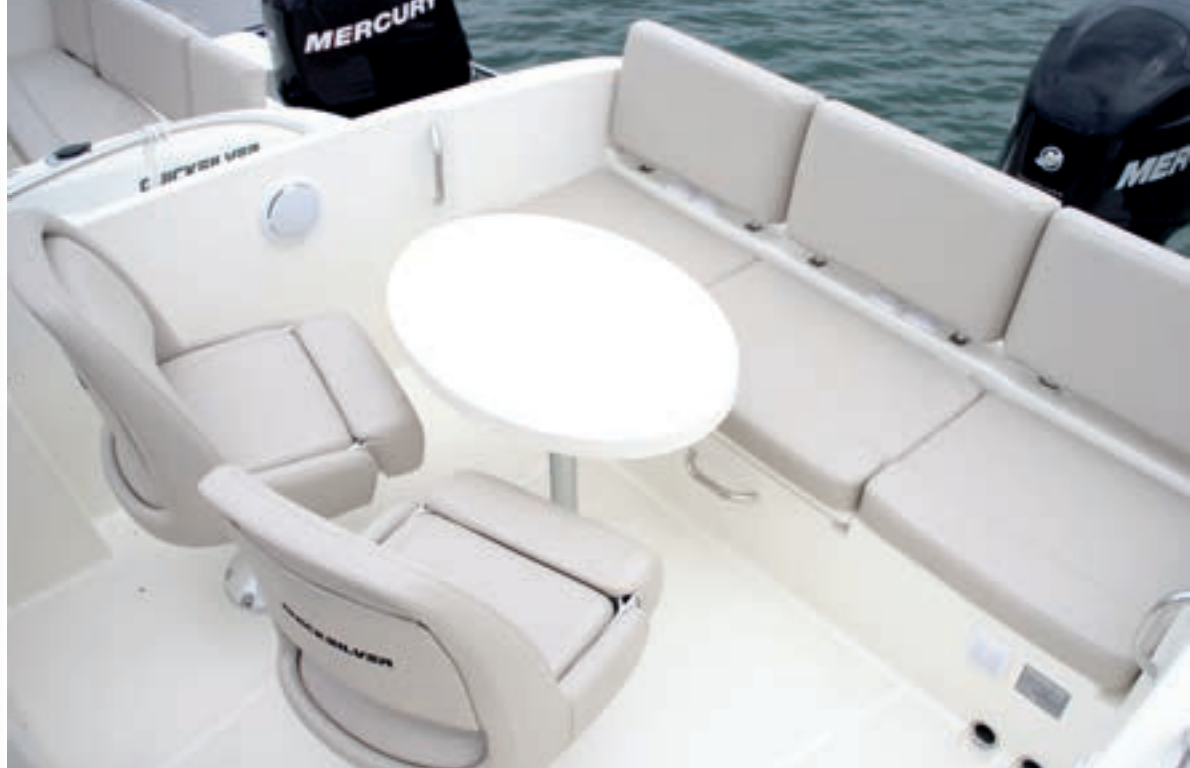
Con una mesa desmontable se forma una dinette añadiendo los asientos giratorios.