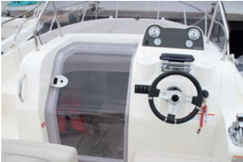
En la versión Sundeck la consola se desplaza totalmente a estribor.