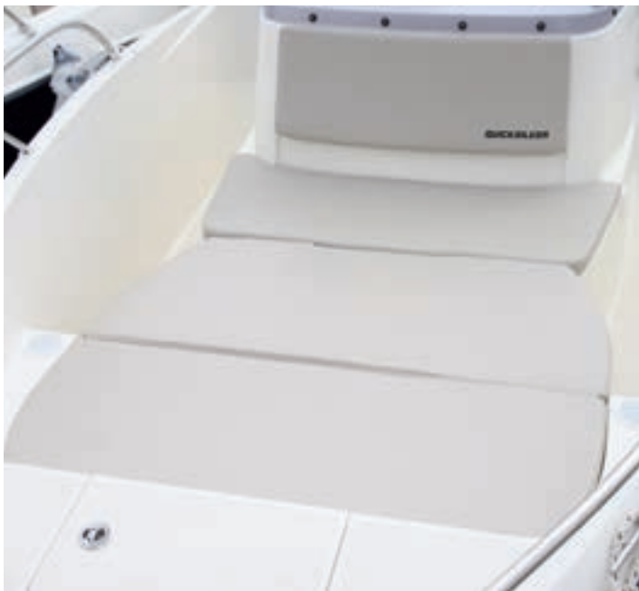
Un suplemento central crea un solárium acolchado en la proa de la Open.

Se le ha dotado de una consola central de diseño moderno y buena anchura, con un protector parabrisas de forma curva, que presenta un puesto de gobierno sencillo en estribor, sin reposapiés y una puerta corredera de metacrilato transparente.