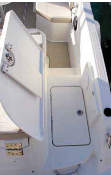
El pasillo de popa oculta un cofre nevera bajo el solárium.

entre 25 y 30 nudos, aunque tuvimos la sensación de que podía montar una potencia menor sin ver mermado su comportamiento. ✎ R. Masabeu