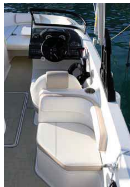
En la VR6 incluye un asiento tras el puesto del piloto.