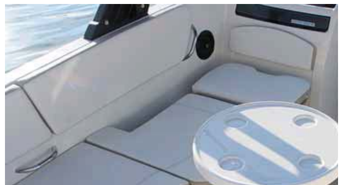
Se crea una dinette bastante espaciosa con una pequeña mesa.

una lancha agresiva que permite alcanzar una velocidad máxima de 41 nudos manteniendo una cubierta seca y buena sensación de seguridad.