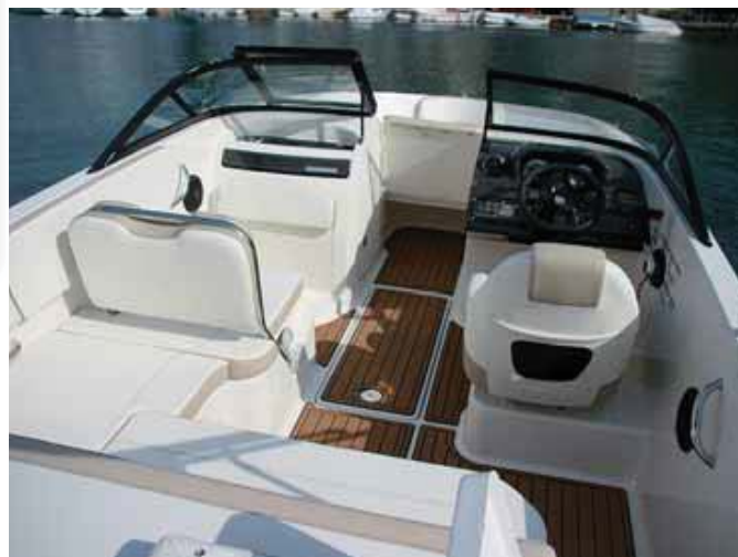
Se ofrece la opción de un agradable acabado en teca sintética.