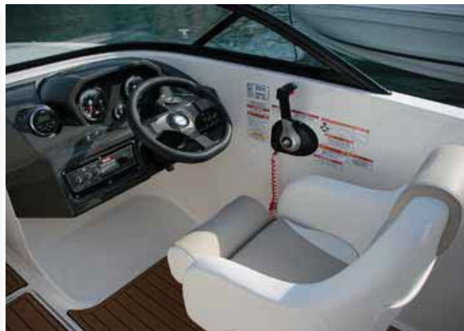
El puesto de gobierno es el típico americano, compacto y bien aprovechado.