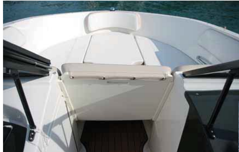
El solárium de proa se cierra con un respaldo de guillotina.

El modelo VR5 puede montar a bordo un intrafueraaborda de máximo 220 hp mientras que la VR6 puede llegar hasta 250 hp. Para la prueba, en ambos casos se había instalado el nuevo motor Mercury Mercruiser 4.5L, específico para uso marino, con 200 y 250 hp respectivamente. Con zonas entre marejadilla y mar rizada, la jornada de pruebas discurrió sin problemas con dos embarcaciones que se mostraron ágiles y maniobrables, con un lógico mayor confort en la opción de mayor tamaño. A bordo de la VR5, con su menor eslora, nos encontramos con