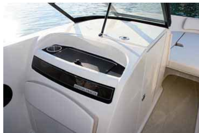
Se consigue una cabina para un inodoro en el pasillo de la VR6.