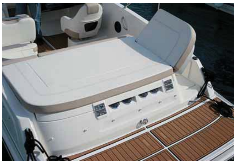
El solárium de popa disfruta de un respaldo lateral practicable.

Pertencientes a una nueva generación de Bowriders, estos modelos también optan por adoptar una proa muy ancha, en este caso con un innovador diseño BeamForward de Bayliner, que proporciona una mayor amplitud en una cubierta en la que cuenta con una bañera delantera con una zona de solárium acolchada que puede desmontar su parte central para formar un asiento. El envolvente parabrisas, bastante adelantado, cuenta con una sección practicable central para formar un pasillo de entrada, cuya parte inferior se cierra con una sección de respaldo acolchado de tipo guillotina.