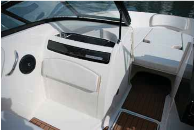
En la VR5 el copiloto se enfrenta a guantera y armario lateral.

do enfrentado a un asiento envolvente de base practicable y giratorio. Cabe destacar que en la VR6, debido a su mayor eslora, éste se complementa con un segundo asiento en su parte posterior enfocado hacia popa.