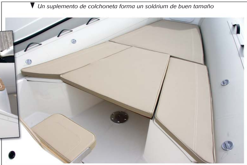
▼ Un suplemento de colchoneta forma un solárium de buen tamaño