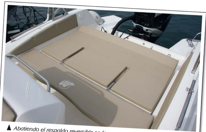
▲ Abatiendo el respaldo reversible se forma en popa un segundo solárium

El ritmo de crucero resultó elevado, entre 24 y 29 nudos, aunque no habría problemas para elevarlo sin renunciar a una buena navegación, con una carena que se mostró muy dócil y suave en los saltos, manteniendo buena estabilidad en los giros más cerrados. ▶ R. Masabeu