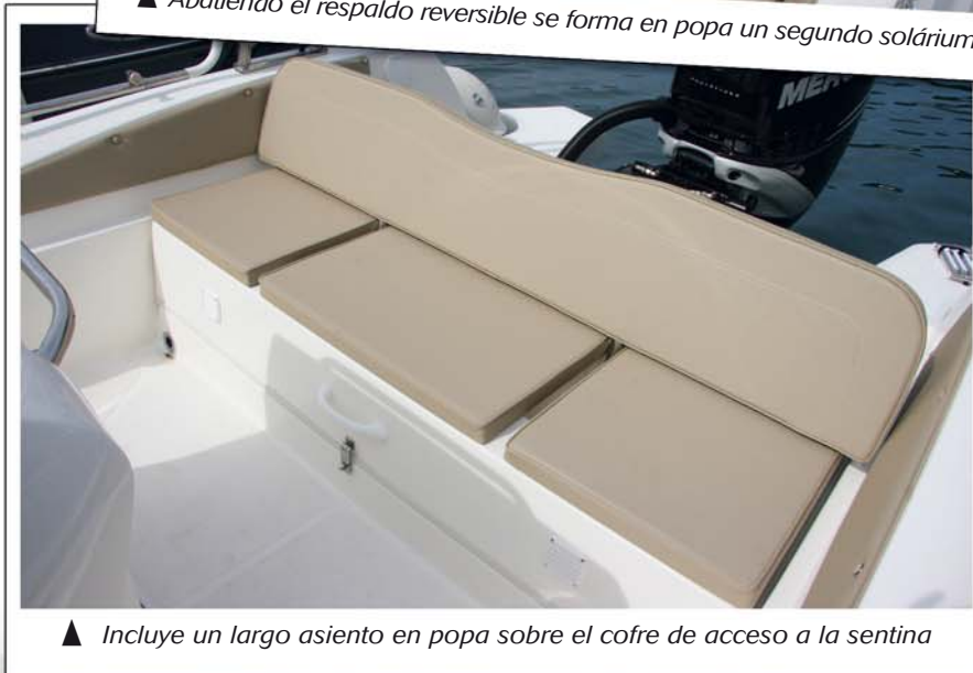
▲ Incluye un largo asiento en popa sobre el cofre de acceso a la sentina

▶ Por la posición de los flotadores se consigue una gran estabilidad en parado