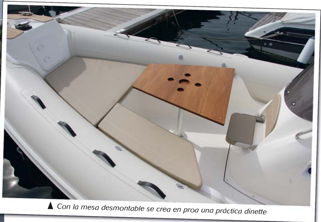
▲ Con la mesa desmontable se crea en proa una práctica dinette

La gama Black Fin fue creada por Mercury Marine para disponer de una línea de semirrígidas de gama alta, tan confortables y deportivas como bien equipadas. Esta gama está concebida además para venderse exclusivamente con motorizaciones Mercury, para lo que se ofrecen en forma de packs embarcación+motor en los que se incluye la preinstalación, de modo que cada modelo cuenta con la gama de potencias más adecuada a cada uso y se disfruta también de la instalación ideal, con tiempos de entrega mucho más rápidos desde el distribuidor al cliente. Actualmente, todos los modelos de la gama Black Fin son construidos para Mercury por el astillero italiano Nuova Jolly, marca de referencia en el mercado, que ha desarrollado interesantes propuestas con carenas de buenas cualidades de navegación.