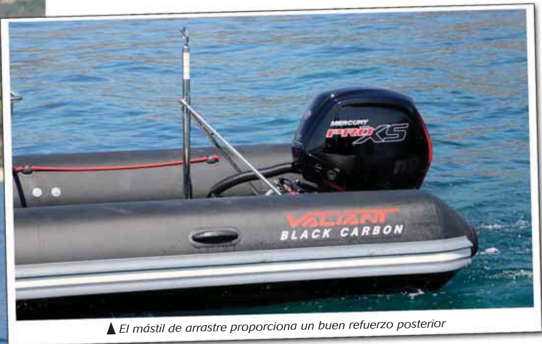
▲ El mástil de arrastre proporciona un buen refuerzo posterior

del suelo y otro situado en el perfil inclinado del espejo de popa, todos ellos con tapas estancas. Con ello se trata de ofrecer una embarcación muy polivalente y fácilmente adaptable a cada necesidad.