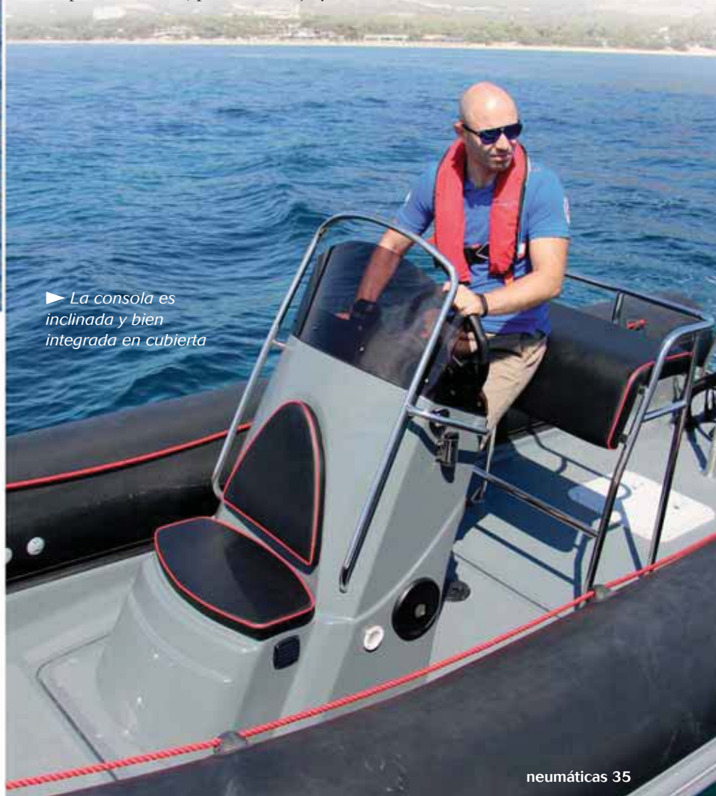
► La consola es inclinada y bien integrada en cubierta

La popa es baja, al más puro estilo profesional, aunque no embarca agua en condiciones normales, situándose a continuación en el modelo de pruebas un mástil alto de arrastre para un esquiador, con soporte misionero de dos brazos. Para el piloto optaba por un asiento bolster de estructura tubular, con buen pasamanos y espacio inferior para un arcón-nevera portátil, además de una estrecha consola central de bonito diseño y tamaño medio, dotada de un asiento en su perfil delantero, parabrisas bajo y dos armarios de estiba.