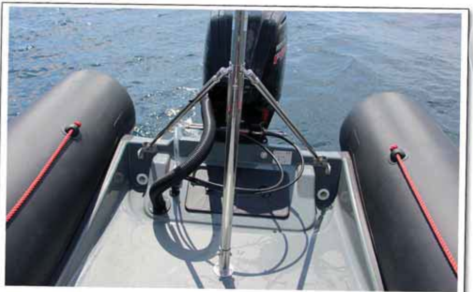
▲ Entre las escuadras de popa se forma un interesante cofre

Con un diseño de carena que ya ha probado sus cualidades en anteriores versiones de cubierta, esta Valiant 630 SEL, había sido dotada para la prueba de un fueraborda Mercury 115 ProXS, recientemente presentado, con transmisión reforzada Command Thrust y alto rendimiento, que permite un uso intensivo para este modelo de grandes posibilidades de adaptación.