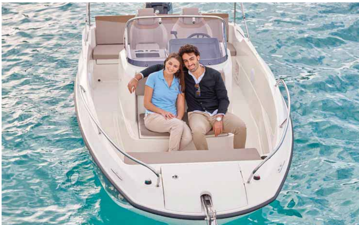
La proa se ocupa mediante una plataforma ancha con cofre de fondoo.

vernos cómodamente en u crucero entre 19 y 21 nudos. La versión Sundeck de esta Activ 605 se mostró algo más asentada, montando un Mercury de 150 CV que nos pareció en principio la potencia más adecuada para